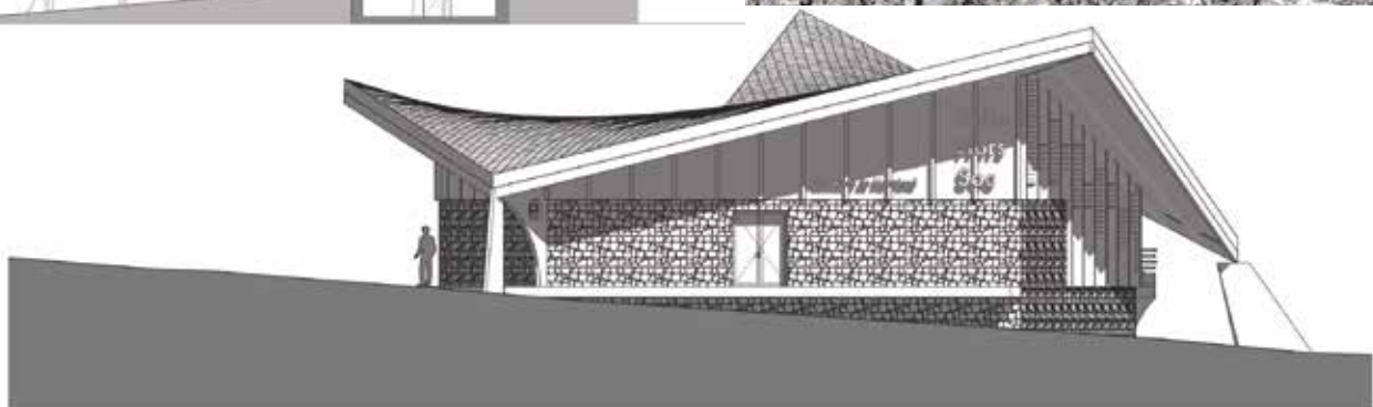
Façade Nord - Est